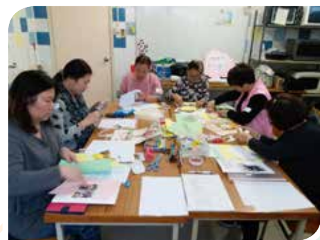
「看見美好的自己」 家長工作坊